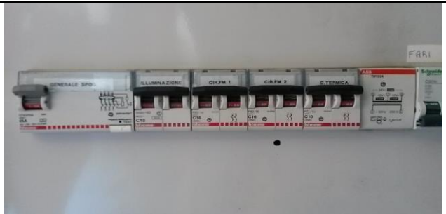
Interruttore generale spogliatoi