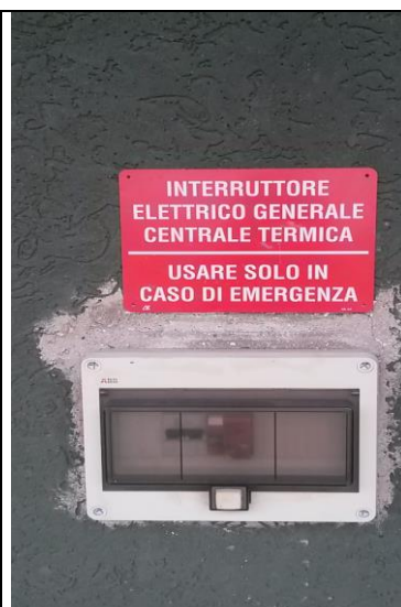
Interruttore generale elettrico