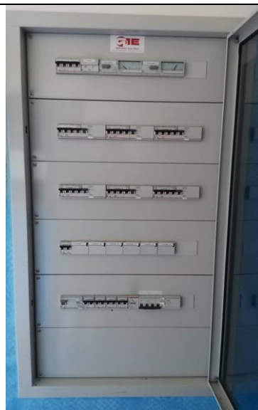
Quadro elettrico generale