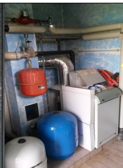
Brucciore e vasi espansione