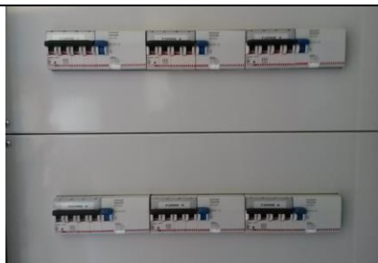
Interruttori fari campo principale