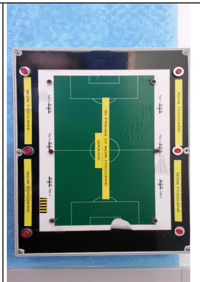
Pannello accensione fari