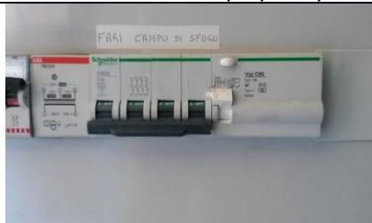
Interruttori fari campo di sfogo